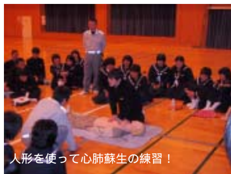
人形を使って心肺蘇生の練習！

発行／有田町消防本部 編集／広報委員会 有田町南原甲940番地 ☎0955-42-2671