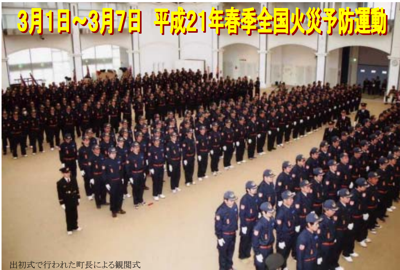
出初式で行われた町長による観閲式