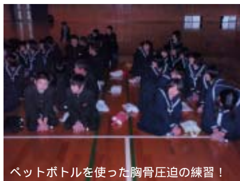
ペットボトルを使った胸骨圧迫の練習！