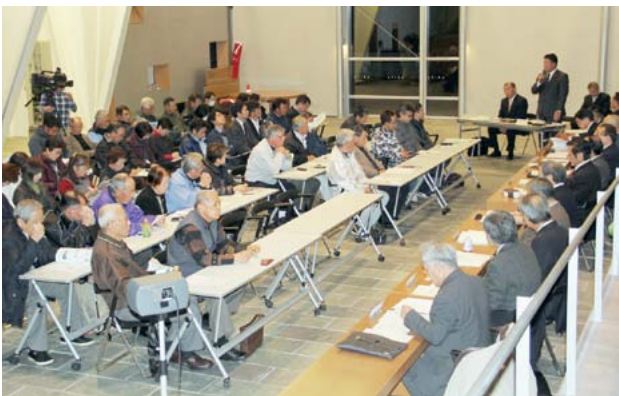
▲質疑応答では、参加者と議員とで活発に意見交換が行われました。

「議員と語ろう会」が役場町民ロビーと生涯学習センターで開催され、町内団体や町民など、計88人が参加しました。 有田の産業振興や教育、福祉などに関する質問や提言を事前に募集し、議員が回答。 今回の意見交換会を踏まえ、議会側より「貴重な意見を町政に反映できるように、町に要望していきたい」と述べました。