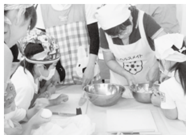
▲園児と一緒にクッキング