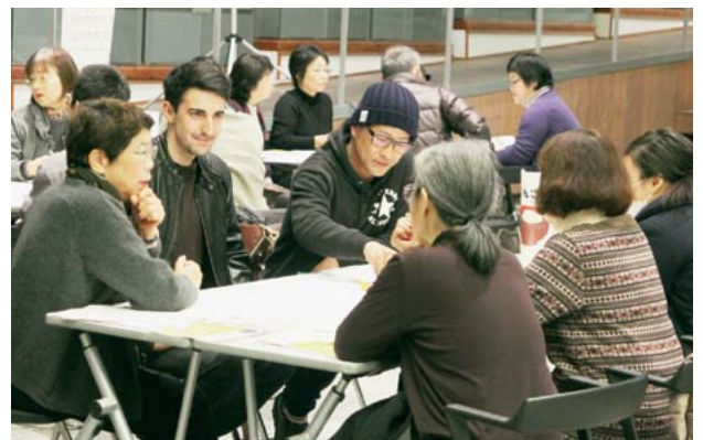
▲ワールドカフェでは「男女のどちらが優先されているか」をテーマにそれぞれの視点から意見交換を行いました。

「ありたんひろば de ワールドカフェ」が役場町民ロビーで開催され、小学5年生から一般まで約40人が参加しました。 「外国の人から見た有田町」というテーマで、町内在住や勤務の外国人3人が母国と日本の比較や感想を述べました。 参加した40代女性は「小学生の参加は新鮮で、新しい視点で学ぶことができた」と話されました。