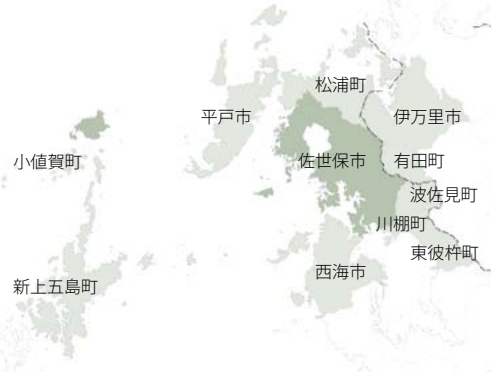
〈連携する5市6町の位置関係〉