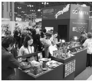
▲先月2月に出席したNY NOW の様相