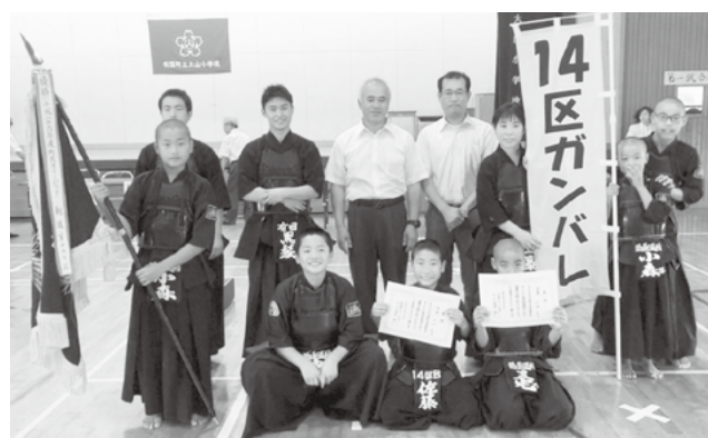
▲優勝した14区Bの皆さん