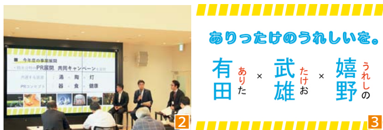
1 左から 松尾佳昭町長 (有田町)、小松政市長 (武雄市)、村上大祐市長 (嬉野市) 2 3首長によるプレゼンの様子 3 連携会議のキャッチフレーズ

〔発行〕 有田町総務課 〒849-4192 佐賀県西松浦郡有田町立部乙2202番地 TEL 0955-46-2111 FAX 0955-46-2100 URL http://www.town.arita.lg.jp/ 〔印刷〕 印刷ショップアリタ