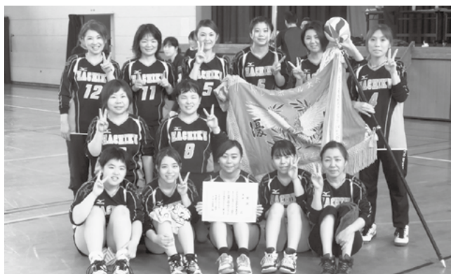
▲優勝した8区の皆さん