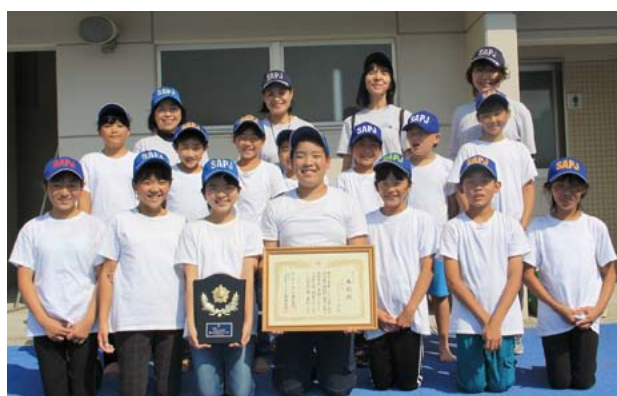
▲水難事故防止の活動後に記念写真を撮影しました。

平成16年から町内の小学生で活動しているSAPジュニア隊が、全国で10団体に贈られた少年補導功労団体に表彰されました。 同団体は、安全で安心な町を目指して基本的な知識とマナーを身につける子どものための体験プログラムで、陶器市のパトロールや護身術などを学んでいます。 現在は、小中学生17人月に1度活動しています。