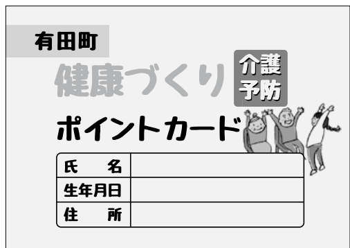
▲有田町健康づくり介護予防ポイントカード見本

佐賀県の公式ウォーキングアプリ「SAGATOCO」をはじめとするスマホのアプリの記録や、ご自身の手帳の記録で条件を満たしていることを確認します。