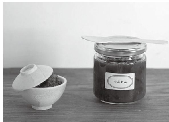
▲町のいろいろな方の協力によって、よりやきものの茶碗に近い「ちやわん最中」が誕生しました。

協力隊の任期は満了しましたが、今後も有田に残って上記の活動を続けていきたいと思っています。皆さん、3 年間大変お世話になりました。この場を借りて感謝とお礼を申し上げます。