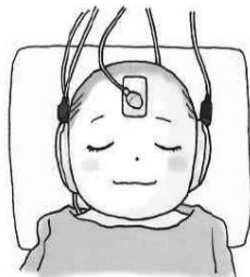
イラスト：(一社)日本耳鼻咽喉科学会

聴こえの障害は目に見えず、発見することが難しいため、気づかずにいると言葉の発達、知能の発達に遅れを生じたり、コミュニケーションが取りづらいなどの支障が起こります。聴こえにくさを早く見つけ、その子に合った適切な指導を受けることで、赤ちゃんの能力を十分に発揮させ、言葉の発達を伸ばすことができます。検査はほとんどの産婦人科で実施していますので必ず受けましょう。検査にかかった費用は、申請することで払い戻