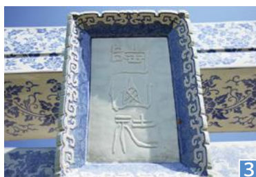
1 修復後の鳥居（大）と修復前の鳥居（小） / 2 裏側から見た磁器製鳥居 / 3 下部がかけていたがきれいになった神額