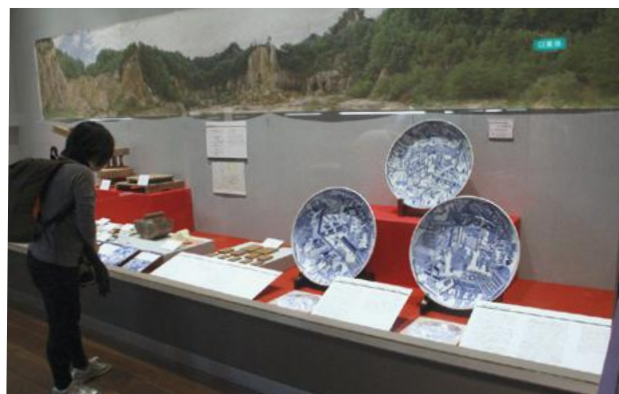
▲秋の有田陶磁器まつり期間中は、県内外からたくさんの方がご来場されました。

12月20日(日)まで「足もとに眠る 有田焼工房を探索!」泉山一丁目遺跡・中樽一丁目遺跡発掘調査報告展」が有田町歴史民俗資料館東館・有田焼参考館で開催されています。 私たちが暮らす町の足もとに眠っていた、有田焼生産現場の姿を「染付有田皿山職人尽し絵図大皿」(佐賀県重要文化財)などの資料と共に探っています。