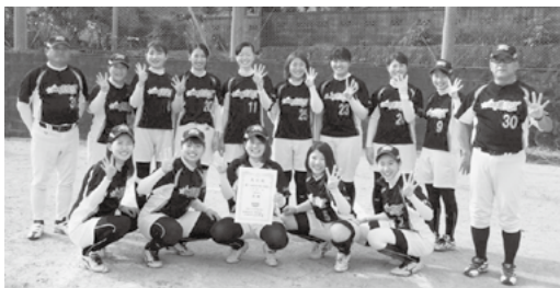
▲ソフトボール一般女子