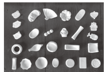
▲イベントのワークショップで使用する絵付け前の箸置き。

てくれるようになりました。『バタバタな毎日』もちょっとした工夫で『豊かな暮らし』に様変わりします。おすす