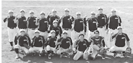
▲軟式野球一般男子B