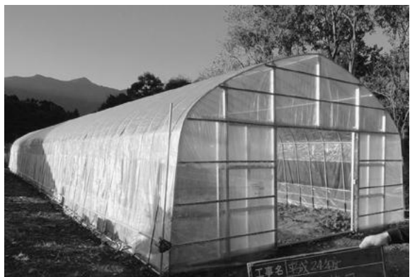
▲園芸用パイプハウス