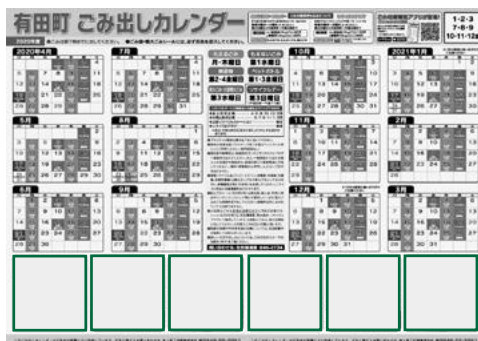
▲令和2年度ごみ出しカレンダー(参考)