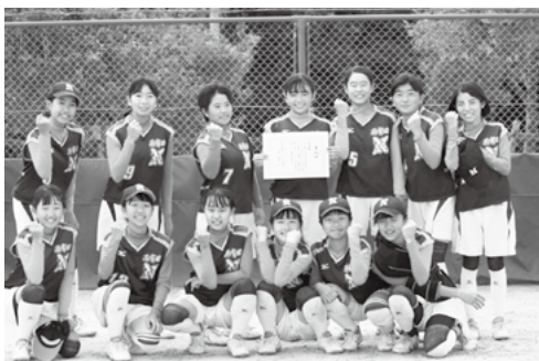
▲伊万里中学生女子秋季ソフトボール大会で準優勝し笑みを浮かべるメンバー

また、10月17日に行われた「伊万里中学生女子秋季ソフトボール大会」では準優勝。11月7日、8日に行われた「佐賀県中学校新人ソフトボール大会」は3位入賞と力を発揮しました。