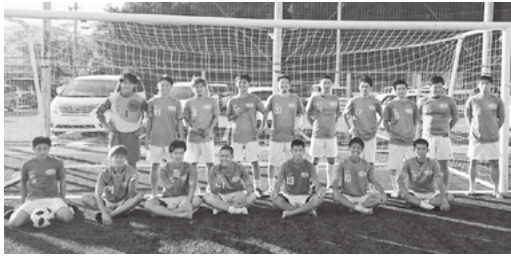
▲サッカー一般男子