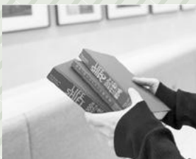
武雄 旅書店 instagram

申込み/発表者は申込みが必要です。(観覧者は不要) カウンターまたは電話、DMによる申込受付。