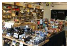
嬉野交流センター