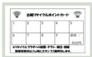
▲リサイクルポイントカード

有田町リサイクルプラザへ新聞・チラシ・雑誌・雑紙・紙製容器（紙パック・紙芯・段ボールは対象外）を持ち込んでいただいた方に対し、その場でポイントカードを発行し、古紙1kgに対しスタンプ1個を押します。スタンプが10個貯まったポイントカードは、そのまま400円の「リサイクル商品券」として、指定の町内商店でのお買い物に使用することができます。