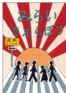
特入 有工1年 樋渡夕葉