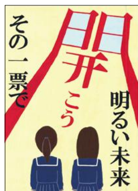
文特入 西中1年 川久保有華

※賞の表記は次のとおりです。(文: 文部科学大臣・総務大臣賞 特: 県特選 入: 県入選 特: 町特選 入: 町入選)