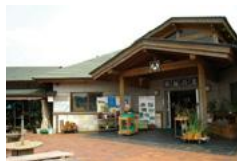
道の駅山内「黒髪の里」