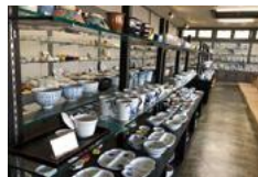
肥前吉田焼窯元会館