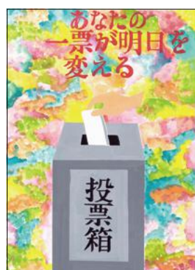
入 有工2年 浅田りな