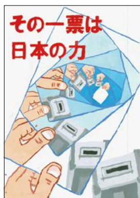
特 西中1年 池田拓巳