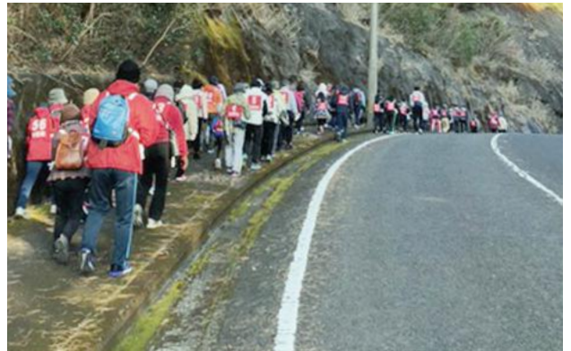
▲高低差のあるコースでしたが自分のペースを保ちながら皆さん完歩されました。

新春歩く会が有田町スポーツ推進委員の協力のもと開催されました。 子どもから大人まで78人が参加し、赤坂球場から竜門ダムまで往復約9kmの道のりを歩きました。速いペースで歩く方から景色を見ながらのんびり歩く方まで各自のペースで心地よい汗を流しました。 完歩した後はひと休みし、来年もまた参加したいとの声が続々と聞かれました。