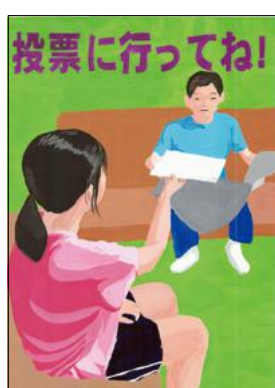
入 有中2年 宝亀 桃星