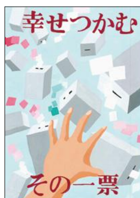
特 西中3年 岸川優