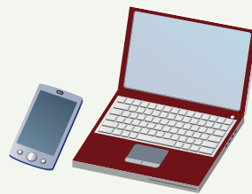
インターネット・ 気象庁ホームページ