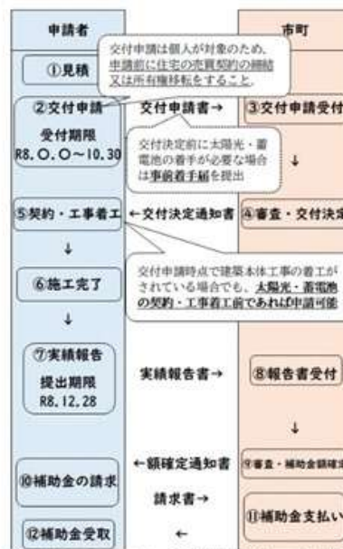
③建売住宅の購入と併せて太陽光発電・蓄電池を設置する

※1 建築工事が完了している建売住宅を購入し、太陽光発電・蓄電池を新たに設置する場合は①通常の場合と同様