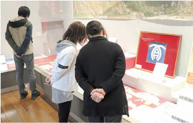
▲期間中は約450人が来館。懐かしい写真を前に足を止め、思い出を語る方もいらっしゃいました。

2025年が昭和100年に当たることを記念し、有田の今までを振り返る企画展「アリタの記憶」昭和・平成・令和の100年」が町歴史民俗資料館東館で開催されました。 来館者は、並べられた過去の写真や発行物など多くの貴重な資料を観覧するとともに、激動の昭和から令和まで紡がれてきた歴史に思いを馳せました。