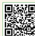
きんかん (個別相談)

子育て支援課 (☎ 25・9200) もしくは下記二次元コードの申込フォームからご予約ください。 ※個別相談のみ要予約。