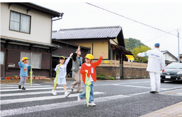
▲児童は警察官から教わったことを守り、手をピシッと上げて横断歩道を渡っていました。

有田中部小学校の新1年生を対象とした交通安全教室が行われました。 児童は、お巡りさんから歩道の歩き方や横断の際に注意することなどを教わり、先生や交通安全指導員とともに校外に出て、実際に安全な歩き方について学びました。 実地で歩道を歩く児童たちは、お互いに横断歩道を渡る際の注意点を確認しながら歩いていました。