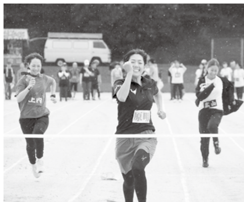
▲昨年のスポーツ大会より(西地区)

今年度の有田町スポーツ協会行事計画が決まりました。4月から開催中の陶器市協賛大会に始まり、町民オリンピックは前期(6月)と後