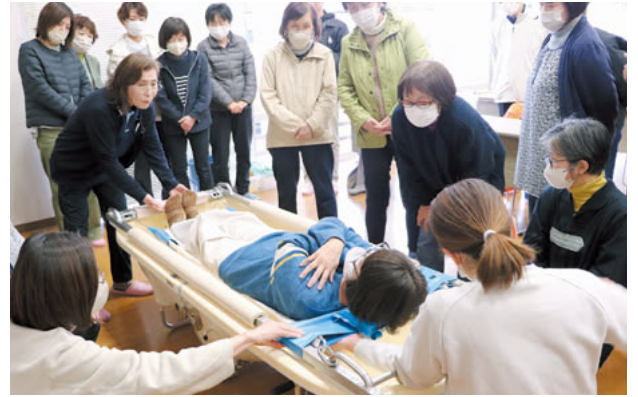
▲実際に体験された方は「家族や自分自身が高齢になった時にこういうケアがあって安心しました」と話されました。

在宅医療・介護連携推進事業の一環として、令和7年度有田町民啓発公開講座が福祉保健センターで行われました。 参加者は、専門講師から訪問看護、訪問歯科診療などの説明や、訪問入浴車の見学などで訪問サービスへの理解を深めました。また、講座の合間に身体機能を高めるさまざまな体操なども体験されました。