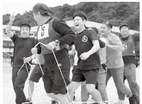
▲昨年のスポーツ大会より(東地区)

ルールを工夫しています。東地区は8区対抗で行い、こちらでも人口減少が問題点です。特に1区と3区は子どもたちが少なく、小学生リレーのメンバー構成に苦慮しています。このような状況を踏まえ、7月に行う東西地区別の「町民スポーツ運営委員会」ではプログラムを修正するなど、改善策を図ります。