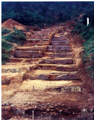
昭和40年代発掘当時の天狗谷窯跡

今の有田があるのは泉山磁石場の発見のおかげです。泉山磁石場の良質で豊富な陶石によって、それまで中国などから多くを輸入するほかなかった磁器を我が国で初めて本格的に量産できるようになりました。そして、泉山磁石場の発見後に磁器の生産だけで産業としてやっていこうとした窯が天狗谷窯でした。その目論みは見事にあたります。農業とも陶器生産とも切り離れて「有田焼」という産業となり、わずか数十年後には国内市場だけでなく、海外にまで輸出されるほど大きく産業が成長しました。泉山磁石場といつもセットで語られる天狗谷窯は有田焼にとってはもちろんのこと日本の窯業にとっても記念碑的な窯と言えるでしょう。