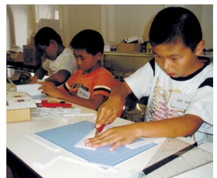
黙々と作業を進める子どもたち