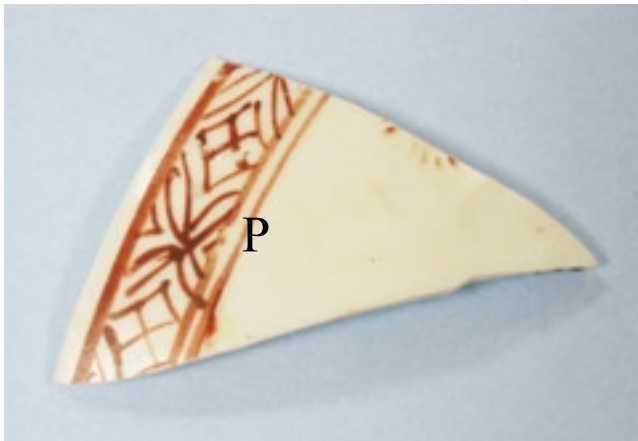
写真2 鹿児島県吹上浜採集赤絵磁器片 (1650～1660年代 九州陶磁文化館所蔵)

酸化鉄、炭酸鉄などの鉱物を焼成して荒い酸化鉄を造り、その後、磁製乳鉢、水、和紙を巧みに使い水中に分散した粒子（水中で大きな粒子は下に沈み、小さな粒子は水面付近に浮遊）を回収して赤絵具原料として利用していたと言われていました。酸化鉄粉末の合成—粉碎—水中での回収—フリットとの均一混合の工程により、赤絵具としての利用を永年試行錯誤しながら繰り返すうちに、先達は微粒子ほど鮮やかな赤が得られやすいことに気づいたのでしょう。