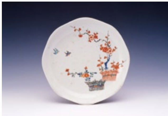
写真1 青磁掛分け色絵柴垣草花文皿 (有田陶磁美術館所蔵)

分析機器が発達してきた今日、世界各地で文化財的(世界遺産的)な陶磁器、ガラス、タイル、レンガなどの窯業製品や建造物の科学的評価が進められています。その目的としては、製造年代や製造技術の推定、