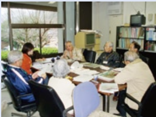
踏査後、検討会の様子(大絵本隊)